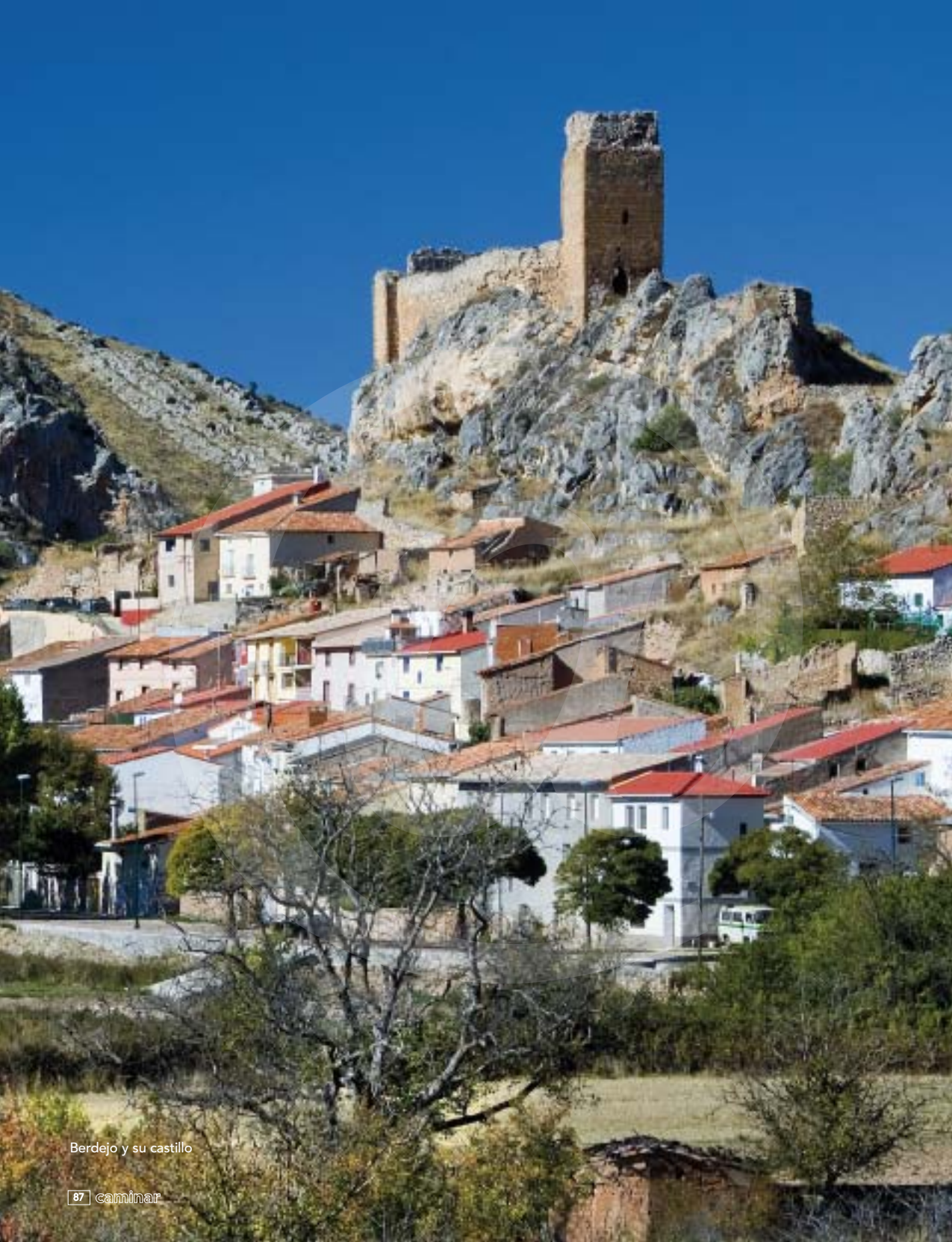
Berdejo y su castillo

El discurrir del río es también inseparable de la presencia humana. Como eje de comunicación por estas tierras altas, y ya en época romana, pasaba por aquí una calzada entre Bilibis (Calatayud) y Numancia (Soria). Romanos y musulmanes iniciaron también una red de acequias que ha llegado hasta la actualidad. Y las obras vinculadas con el agua nunca han cesado, dejando un importante legado en forma de puentes, fuentes, azudes o pequeñas centrales hidroeléctricas, como hemos visto. La Edad Media, desde el siglo XI al XV, es el periodo histórico que más restos monumentales ha dejado, entre ellos los castillos y fortificaciones que, en el Manubles, tuvieron extraordinario protagonismo en las guerras con Castilla, en la denominada guerra de los Dos Pedros que enfrentó a Pedro I de Castilla y a Pedro IV de Aragón entre 1356 y 1369. El conflicto bélico asola la frontera entre los dos reinos, con especial virulencia en las tierras del Jiloca, Calatayud y el Moncayo. Fracasado el intento aragonés de invasión de Castilla con la derrota de Nájera, el monarca castellano entra en Aragón y, entre otros, conquista las fortalezas rayanas de Berdejo, Bijuesca y Torrijo, en el valle del Manubles. La paz de Terrer en 1361 y la mediación del Papa Inocencio VI –por medio del cardenal de Bolonia–, consiguen la devolución de los castillos aragoneses.