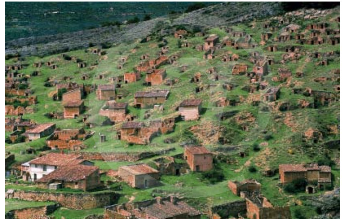
Bodegas de Torrijo de la Cañada